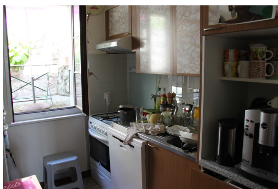
3 pièces côté Ouest