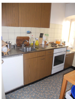
Studio Pestalozzi rez-inférieur