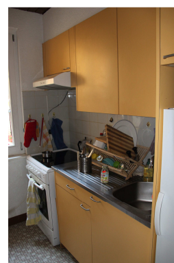
3 pièces côté Est